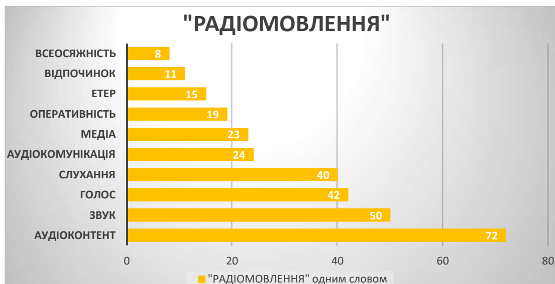
Рис. 3. Рейтинг асоціативних відповідників до терміна «радіомовлення» від аудиторії дослідження (2022 р.)

вищих позначках рейтингу, що також сприймається очікувано. Зрештою, маємо також відповідники для трьох основних функцій телерадіомовлення: інформувати – «контент», пізнавати – «комунікація», розважати – «відпочинок».