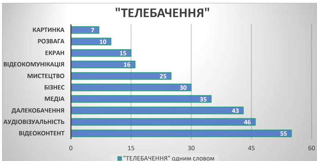
Рис. 2. Рейтинг асоціативних відповідників до терміна «телебачення» від аудиторії дослідження (2022 р.)

Наступні запитання були пов'язані з асоціативним розумінням термінів «телебачення» і «радіомовлення», а саме: студентам запропоновано знайти для цих термінів власний відповідник «одним словом». Зібрані дані, які в статті подані як top-10, стали додатковою ілюстрацією авторських висновків. Найбільше голосів із 352 опитаних отримали аудіовідеоваріанти відповідника «контент» (55 голосів для «телебачення» і 72 – для «радіомовлення»). Високі «рейтинги» отримали й відповідники, які вказують на функціональні особливості телерадіомовлення – «аудіовізуальність», «далекобачення», «звук» та «голос».