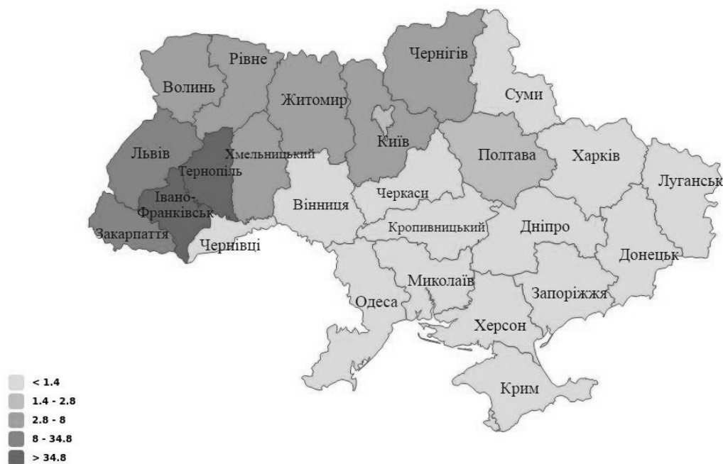
Рис. 1. Географія вступників на ІЕІ

Подана діаграма на рис.3 характеризує ефективність профорієнтаційної роботи, шляхом порівняння кількості шкіл у районах Івано-Франківської області до кількості абітурієнтів із цих шкіл. І показує що в деяких районах нашої області (наприклад Надвірнянському, Тисменицькому та ін..) профорієнтаційна робота серед школярів проведена недостатньо, хоча ці райони знаходяться в безпосередній близькості до університету.