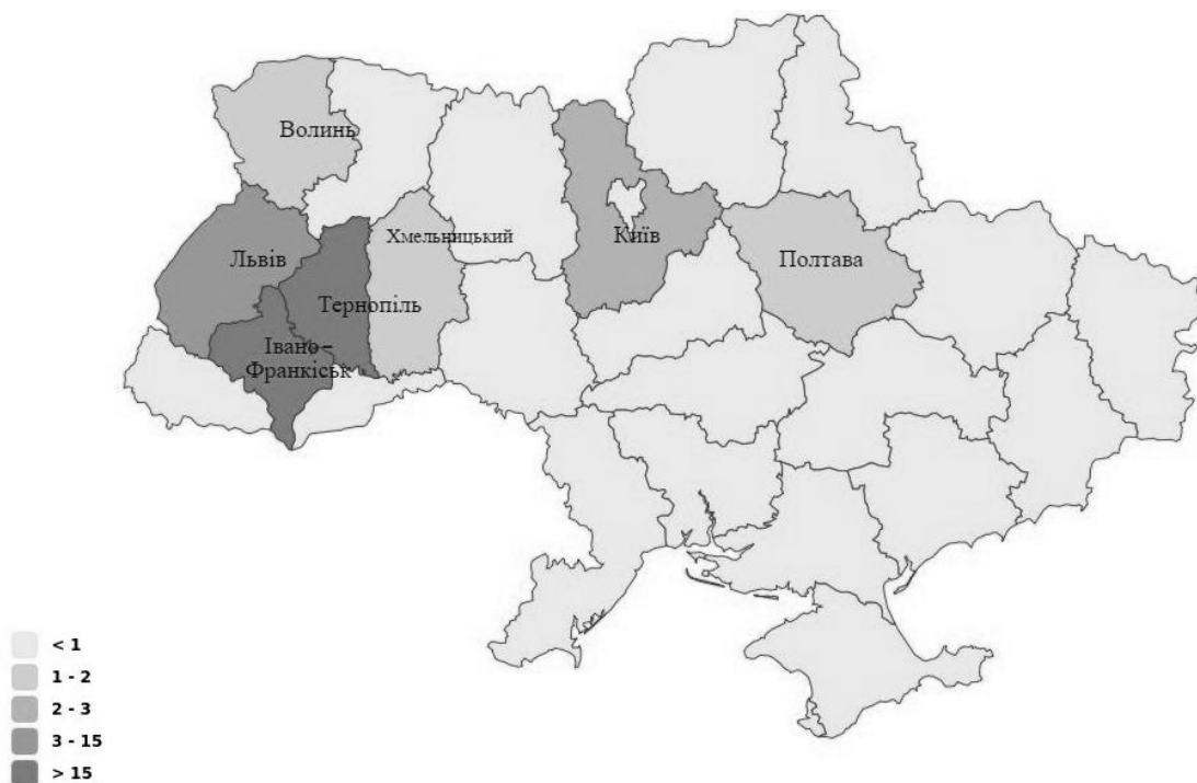
Рис. 2. Географія абітурієнтів, котрі поступили на ІЕІ після закінчення коледжів