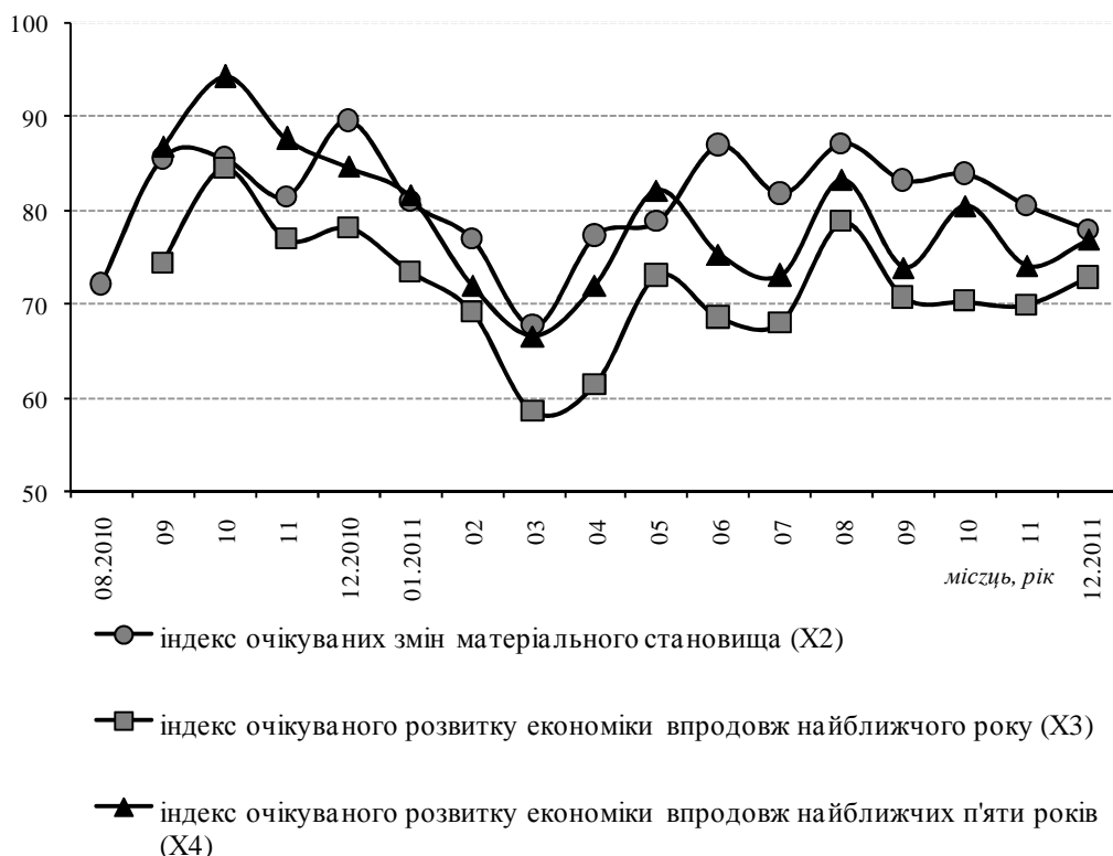
Рис. 2. Складові очікуваних змін у матеріальному становищі домогосподарств і розвитку економіки України у 2010-2011 рр.*

* Розроблено автором за даними GFK Ukraine [4].