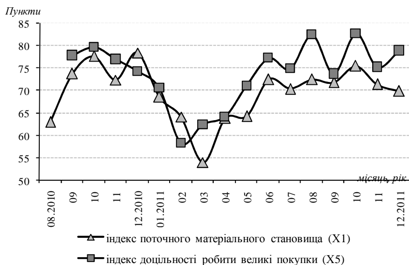
Рис. 1. Складові поточного становища домогосподарств у 2010-2011 рр.*

* Розроблено автором за даними GFK Ukraine [4].