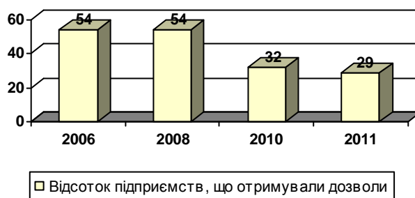
Рис. 2. Динаміка показника отримання дозволів на здійснення діяльності суб'єктами господарювання за 2006-2011 рр., %*

Проте, попри значні обсяги прямих витрат, в Україні згідно з опитуванням IFC простежується негативна динаміка отримання дозволів на здійснення господарської діяльності (рис. 2).