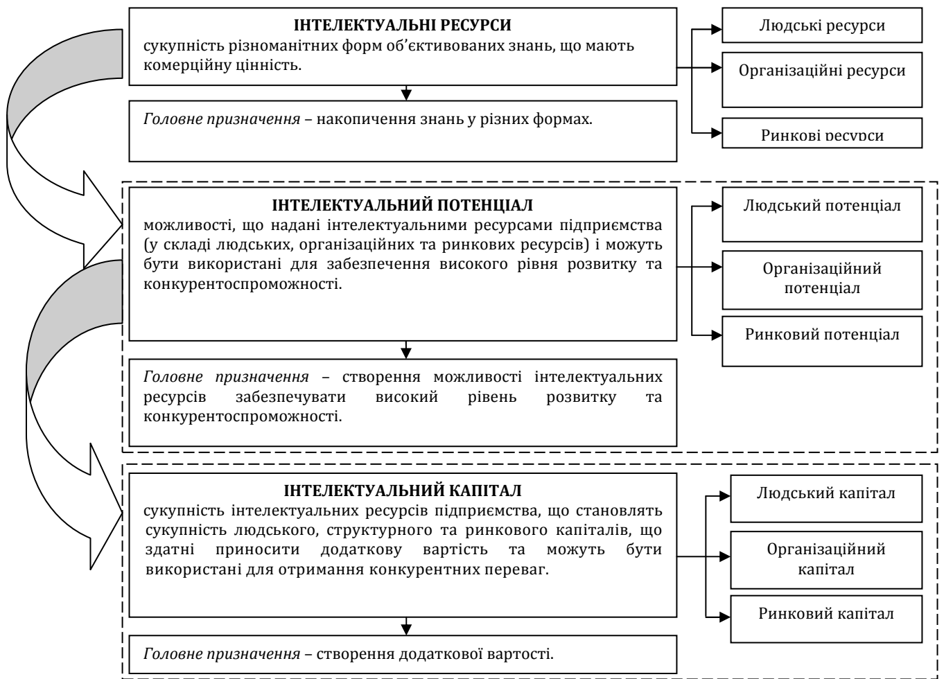
Рис. 2. Співвідношення інтелектуальних ресурсів, інтелектуального потенціалу та інтелектуального капіталу підприємства*