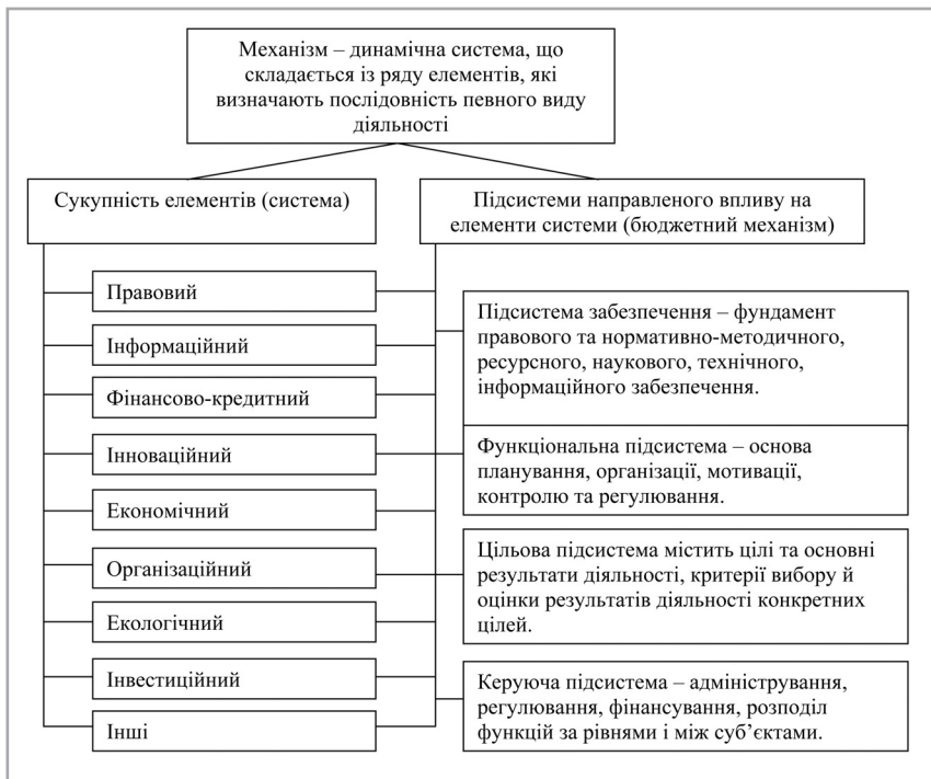
Рис. 1. Дуалізм підходів до трактування категорії «механізм» із позиції елементів та систем управління

необхідно брати до уваги одну надзвичайно важливу обставину – усі процеси в економіці відбуваються циклічно. Ігноруючи невідворотність циклічних коливань, неможливо вчасно запобігти кризовим явищам у бюджетній сфері. Тож очевидно, що бюджетний механізм за своїм характером повинен бути динамічним.