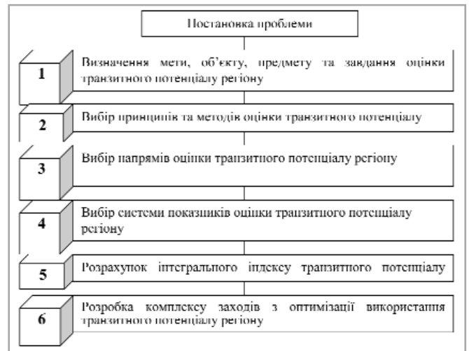
Рис. 1. Алгоритм проведення оцінки транзитного потенціалу регіону

Узагальнивши проаналізовані нами підходи до оцінки транзитного потенціалу, ми розробили авторський підхід до оцінки транзитного потенціалу регіону (рис.1).