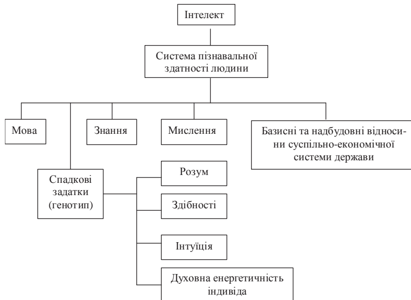
Рис. 2. Структурна схема інтелекту

Узагальнюючи вищезазначене, при цьому розуміючи, що деякі позиції мають ще дискусійний характер, побудуємо загальне визначення сутності інтелектуального потенціалу: це вища сис-