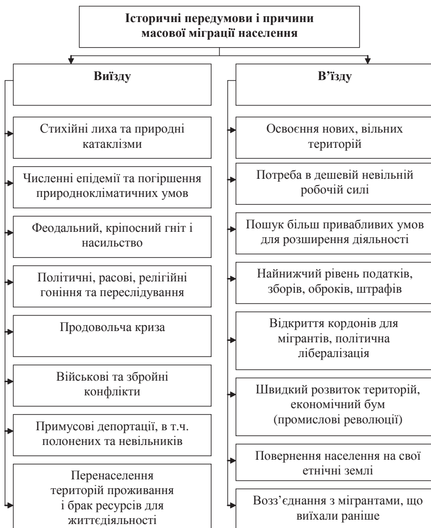
Рис. 2. Основні історичні передумови та причини масової міжнародної міграції населення

жать від різних видів ресурсів. Зрозуміло, що ці галузі не можуть бути розміщені там, де є значні і недорогі трудові ресурси — потенційні мігранти, але немає необхідних природних ресурсів.