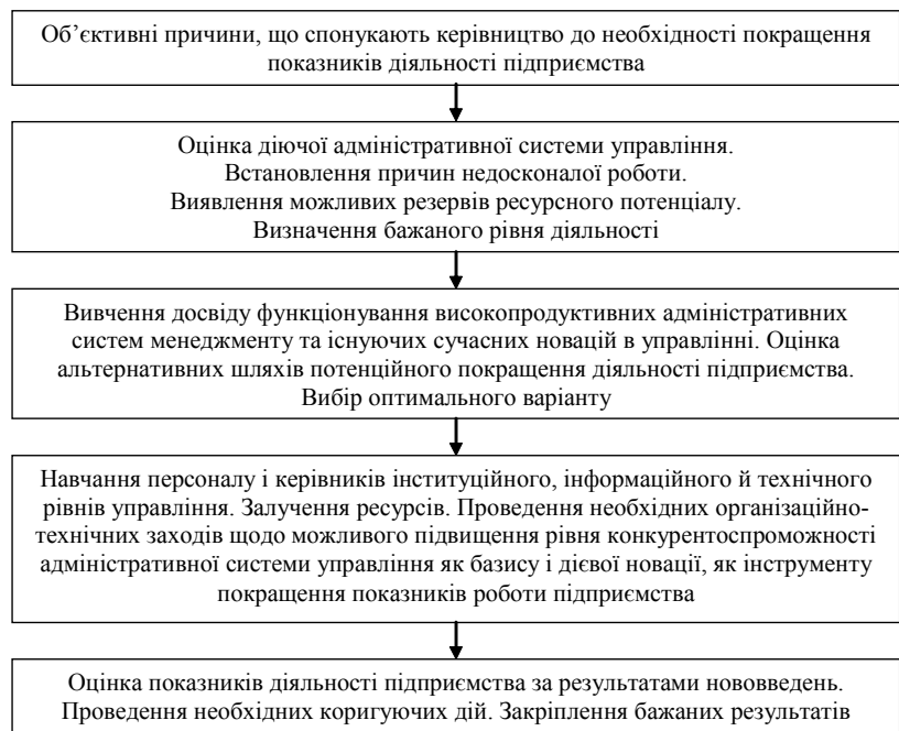
Рис. 2. Основні етапи покращення функціонування системи адміністративного менеджменту підприємства

1. Новіков Б.В. Основи адміністративного менеджменту: навч. посіб. / Б.В. Новіков, Г.Ф. Сініок, П.В. Круш. — К.: Центр навчальної літератури, 2004. — 560 с.