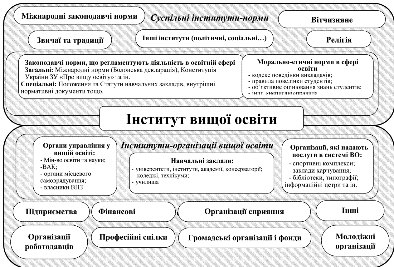
Рис. 1. Інститут вищої освіти в інституційній структурі суспільства