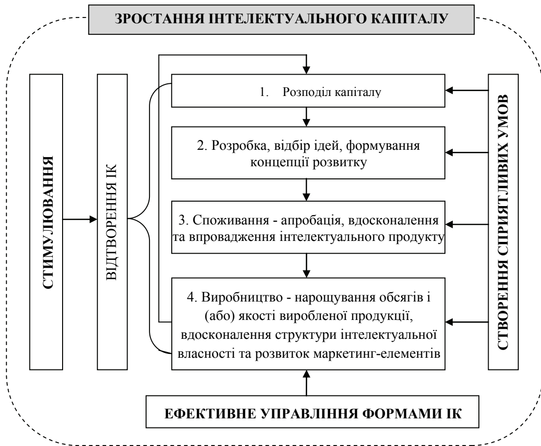
Рисунок 2. Структура процесу зростання ІК (авторська розробка)

Основною функцією ІК є інноваційний розвиток підприємства за рахунок створення нових для ринку технологічних, виробничих, організаційних та інших переваг, реалізація яких забезпечить підприємству значний приріст прибутку, який автором далі розглядається як показник результату зростання інтелектуального капіталу [5].