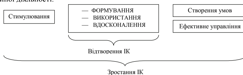
Рисунок 1. Принципова схема сутності «зростання ІК» [авторська розробка]

Крім того, відтворення ІК потребує від підприємства певного комплексу дій, які необхідно здійснювати до, під час та після процесу відтворення, тому авторська позиція визначає зростання ІК більш широко ніж його відтворення, тобто зростання ІК розглядається як комплекс дій з боку підприємства в умовах стратегічних змін, спрямований на відтворення ІК, що включає: стимулювання процесу відтворення ІК, безпосереднє відтворення ІК, створення сприятливих умов здійснення кожного його етапу та ефективно управління створеними та існуючими на підприємстві формами ІК, рис.1 та рис.2.