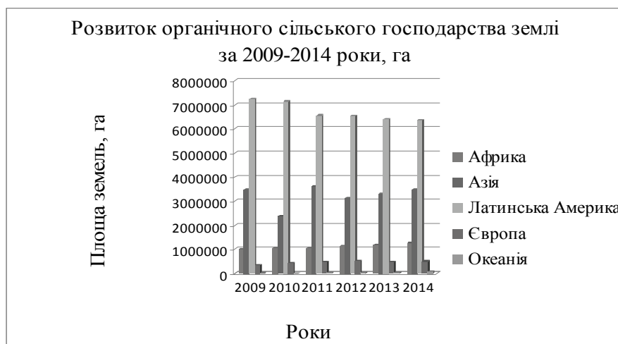
Рис.1. Динаміка сільськогосподарських площ, зайнятих під виробництвом органічної продукції, 2009-2014 рр., га