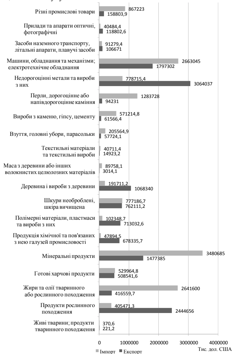
Рис. 1. Зовнішня торгівля України з країнами ЄС [складено авторами за[3]]

Стратегічні рішення керівників безпосередньо впливають на систему організації виробництва підприємства. Так, бажання вийти на європейський рівень змушує українських виробників шукати шляхи підвищення якості продукції, що безпосередньо впливає на весь виробничий процес. Потрібно зазначити, що на даний час навіть на досить сучасних українських підприємствах все ще залишається багато ручної праці, що не дозволяє вітчизняній продукції конкурувати з європейською як за якістю, так і за ціною. Як наслідок, можемо спостерігати тенденцію того, що на експорт до країн Європейського Союзу йде сировина та напівфабрикати, а в Україну імпортується готова продукція, досить часто виготовлена з вітчизняної сировини (див. рис. 1).