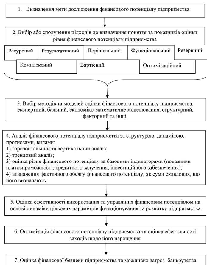
Рис. 1. Зміст та послідовність оцінки фінансового потенціалу підприємства [сформовано авторами за [6, 13]]

Процес оцінювання фінансового потенціалу підприємства пропонуємо здійснювати з використанням наступної методики (рис. 1). За такої умови методика оцінювання фінансового потенціалу повинна базуватися не на оцінюванні існуючих та прогнозованих фінансових результатів підприємства та суми залучених кредитів, а на оцінюванні фінансових результатів від втілення в життя всіх видів планів підприємства (інвестиційного, виробничого, маркетингового, плану перепідготовки кадрів тощо).