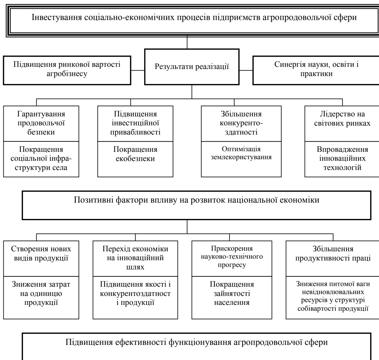
Рис. 1. Механізм впливу соціальних інвестицій на економічні та соціальні процеси агропродовольчої сфери

Реалізація механізму впливу соціальних інвестицій на економічні та соціальні процеси агропродовольчої сфери повинно привести до підвищення ефективності і конкурентоздатності вітчизняної аграрної економіки. Ефективність соціальних інвестицій в агропродовольчій сфері, як результат інвестиційного проекту (програми) і її різноманітні форми, по суті, є виразом певних інтересів учасників інвестиційного проекту або суспільства в цілому. Основна складність оцінки соціальних інвестицій полягає у визначенні суспільної вигоди отриманої в результаті здійснення певної інвестиційної програми, яка часто не піддається не тільки грошовій, а і просто кількісній оцінці.