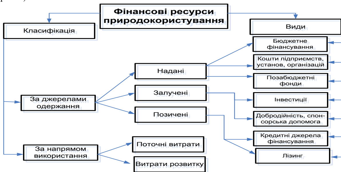
Рис. 2. Класифікація фінансових ресурсів природокористування*

Фінансові ресурси забезпечення природоохоронної сфери – це фонди грошових коштів, призначені для фінансування розширеного відтворення та матеріального стимулювання. Джерелами фінансових ресурсів є всі грошові доходи й надходження (рис. 2).