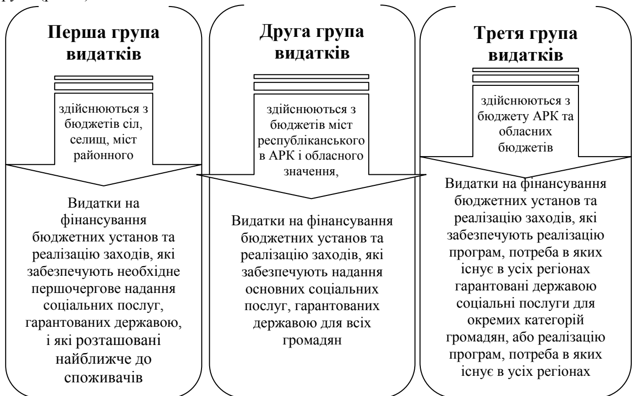
Рис. 2. Розподіл видатків між місцевими бюджетами

Фінансування суспільних послуг здійснюється за рахунок державного або місцевих бюджетів. На сьогодні актуальною проблемою являється розподіл функцій, завдань та повноважень на здійснення видатків між державним та місцевими бюджетами, а також між місцевими бюджетами різних видів. Відповідно до бюджетного кодексу у видатковій частині місцевих бюджетів видатки поділені на три групи (рис. 2).