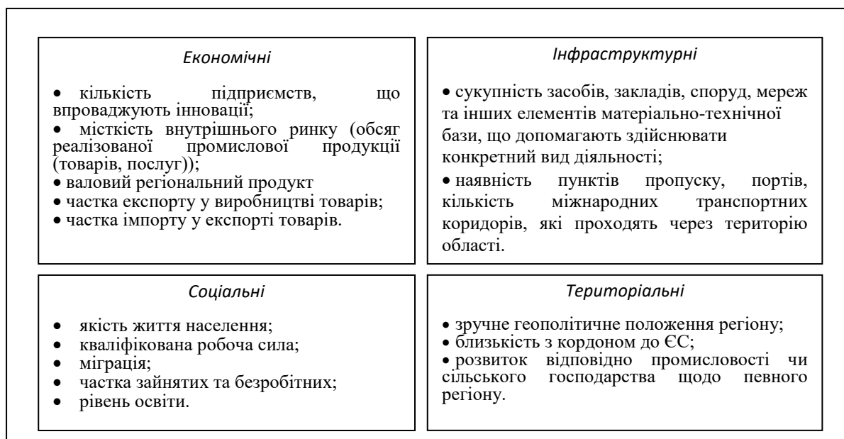
Рис. 2 «Особливості конкурентоспроможності регіонів»