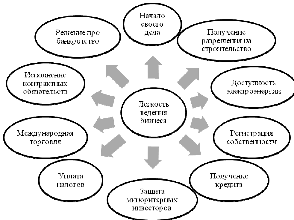
Рис. 1. Составляющие рейтинга «Легкость ведения бизнеса»

Сравнение рейтингов 2013 и 2014 годов показало общее ухудшение состояния в сфере ведения бизнеса в Украине (рис. 2).