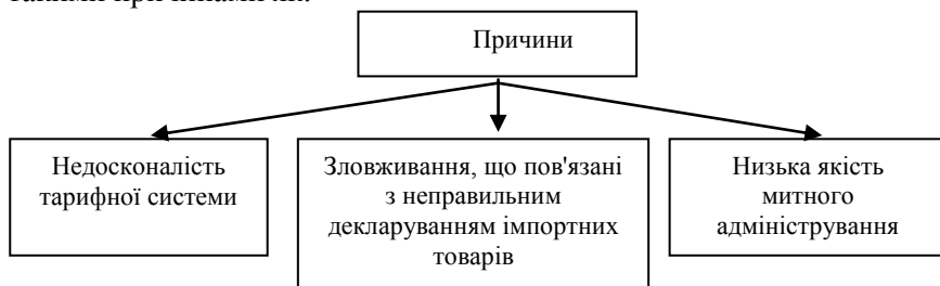
Рис.4. Причини, які зумовлюють необхідність вдосконалення митного тарифу

Необхідність вдосконалення митного тарифу зумовлено такими причинами як: