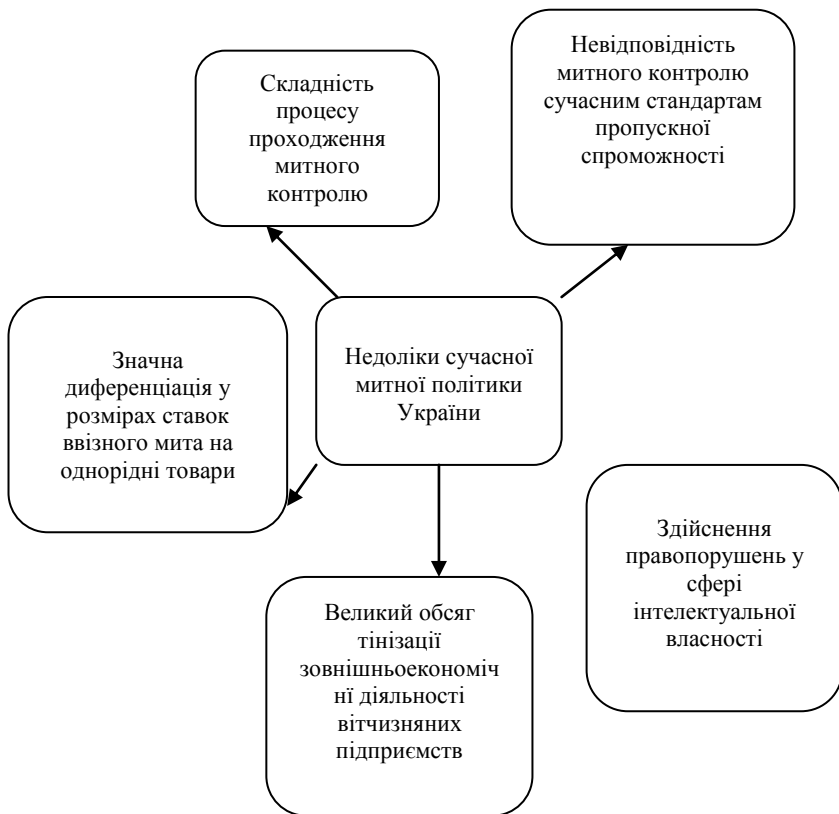
Рис.3. Недоліки сучасної митної системи України

На жаль, сьогодні, існуюче регулювання не відповідає стандартам ГАТТ/СОТ. Перш за все, – це відставання митного контролю від сучасних потреб пропускної здатності та світових стандартів контролю товарів.