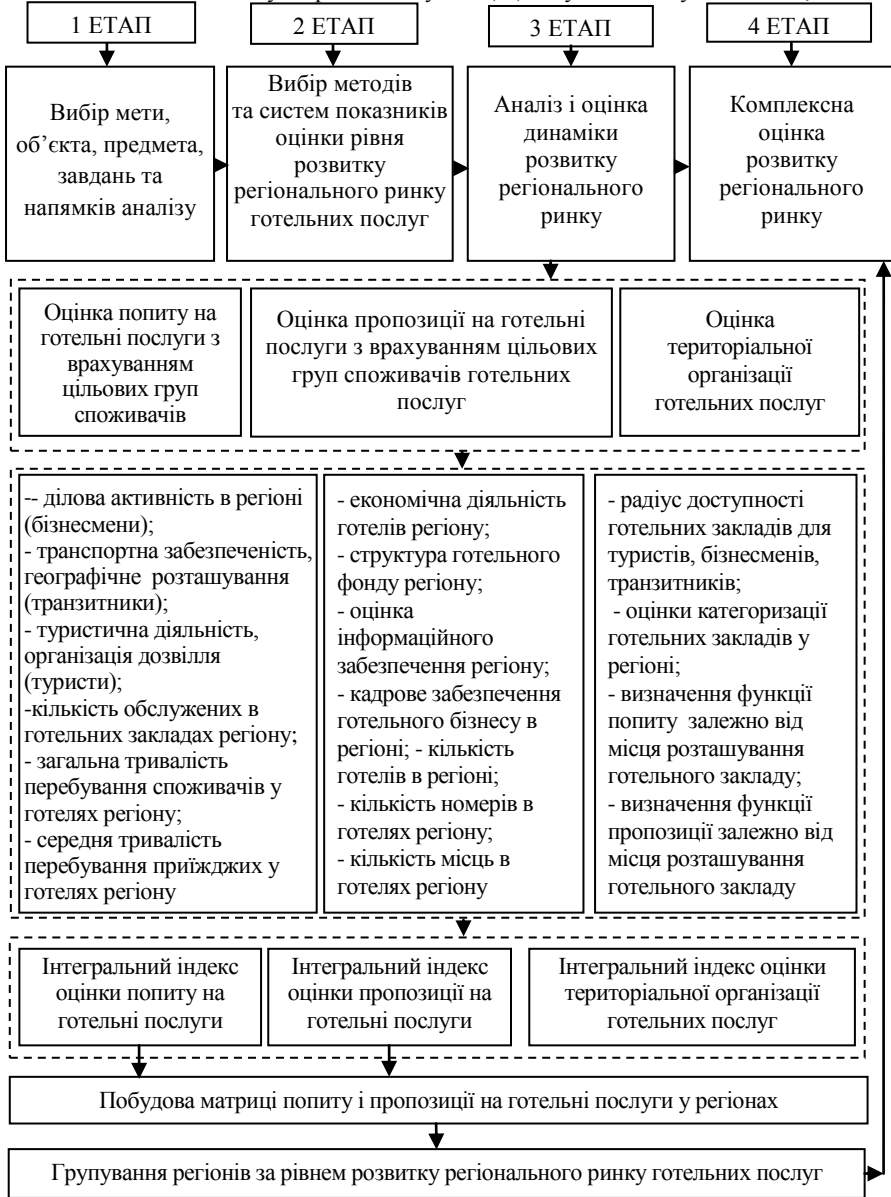
Рис. 2 Етапи аналізу та оцінки рівня розвитку регіонального ринку готельних послуг*