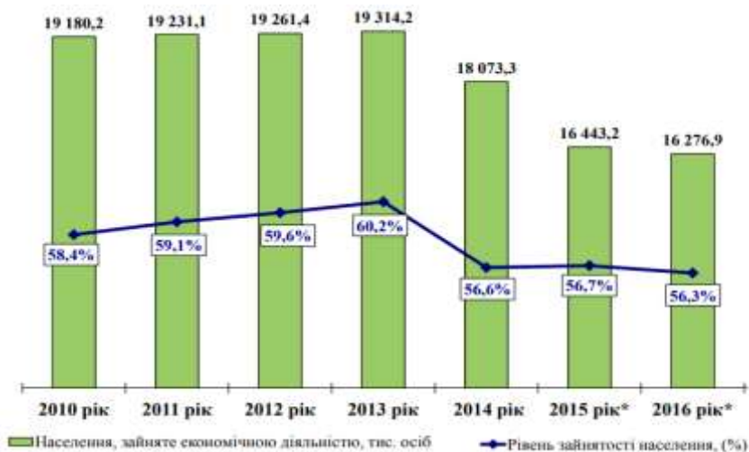
Рис. 3. Зайняте населення у віці 15 – 70 років та рівень зайнятості населення

Для економічного стану регіону та соціального становища зайнятості населення важливе значення має показник просторового розміщення й функціонування трудових ресурсів, як рівня розвитку людського капіталу в регіонах (рис. 3).