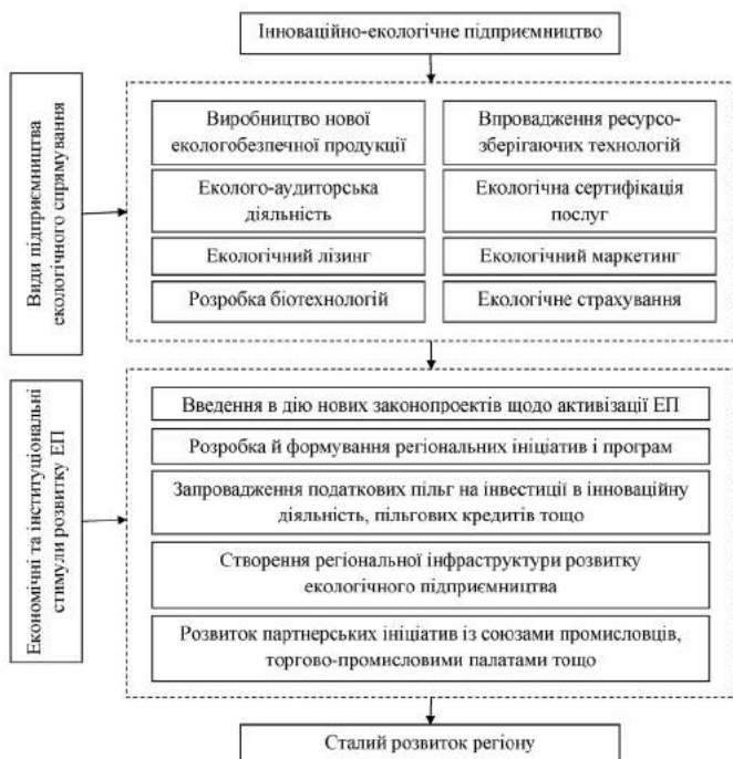
Рис. 3. Схема забезпечення сталого розвитку регіону через розвиток екологічного підприємництва

розвиток підприємницького сектора в Україні. Згідно із Законом України «Про державну підтримку малого підприємництва» [8] державна підтримка необхідна для сприяння формуванню й розвитку малого підприємництва як провідної сили в подоланні негативних процесів в економіці та забезпеченні сталого позитивного розвитку суспільства.