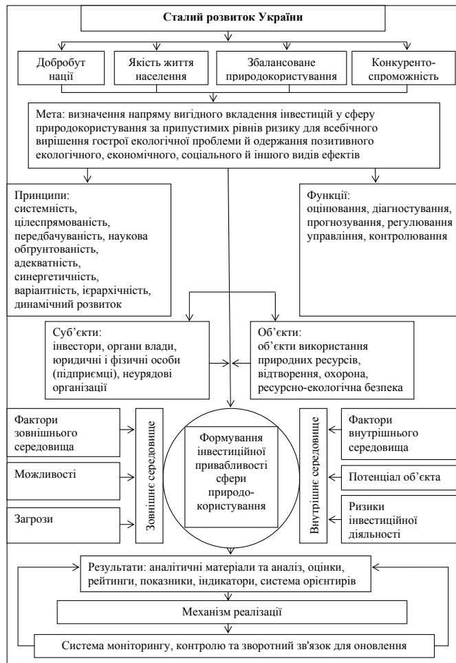
Рис. 2. Формування інвестиційної привабливості у сфері природокористування