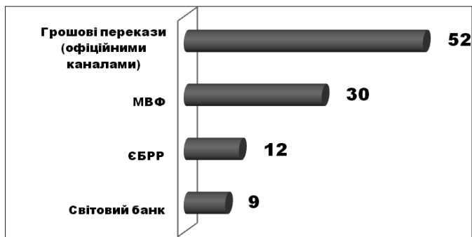
Рис. 4. Обсяги отриманих Україною кредитів, інвестицій і грошових переказів за 1992–2013 роки, млрд дол.