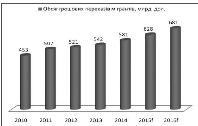
Рис. 2. Динаміка грошових переказів трудових мігрантів за 2010-2016 роки 1