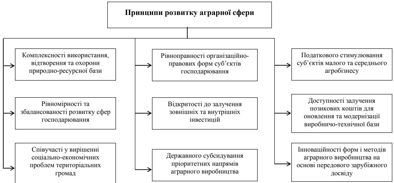
Рис. 2. Принципи формування та розвитку аграрної сфери