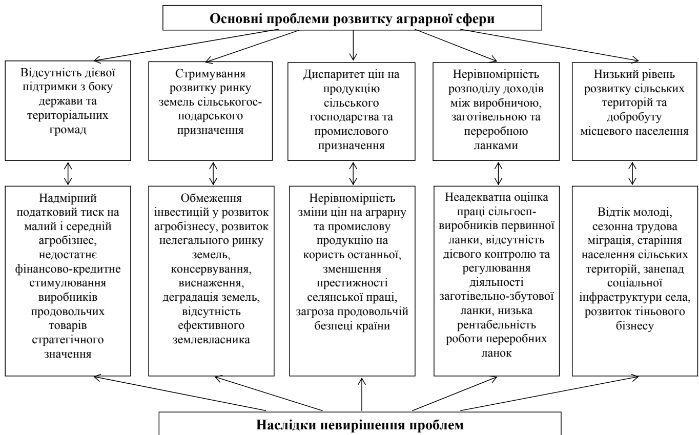
Рис. 3. Основні проблеми розвитку аграрної сфери та наслідки їх не вирішення (узагальнено авторами на основі джерел [1, 3, 7, 9])

□ інноваційності форм і методів аграрного виробництва на основі передового зарубіжного досвіду – передбачає орієнтацію суб’єктів господарювання на використання сучасних прогресивних підходів в усіх сферах агробізнесу.