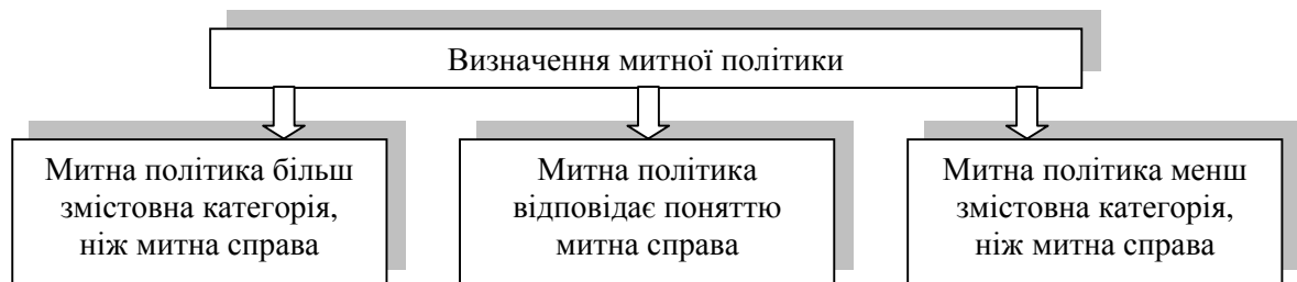
Рис. 1. Термін «митна політика» порівняно з терміном «митна справа» у поглядах вітчизняних та іноземних науковців

Дослідження в напрямі визначення «митної політики» поділилися на декілька груп. Одні визначають митну політику як категорію більш змістовну, ніж «митна справа», інші говорять про входження митної політики до категорії «митна справа», деякі встановлюють тотожність цих двох понять (рис. 1). Тому виникає необхідність сформулювати зміст і значущість цих двох категорій.