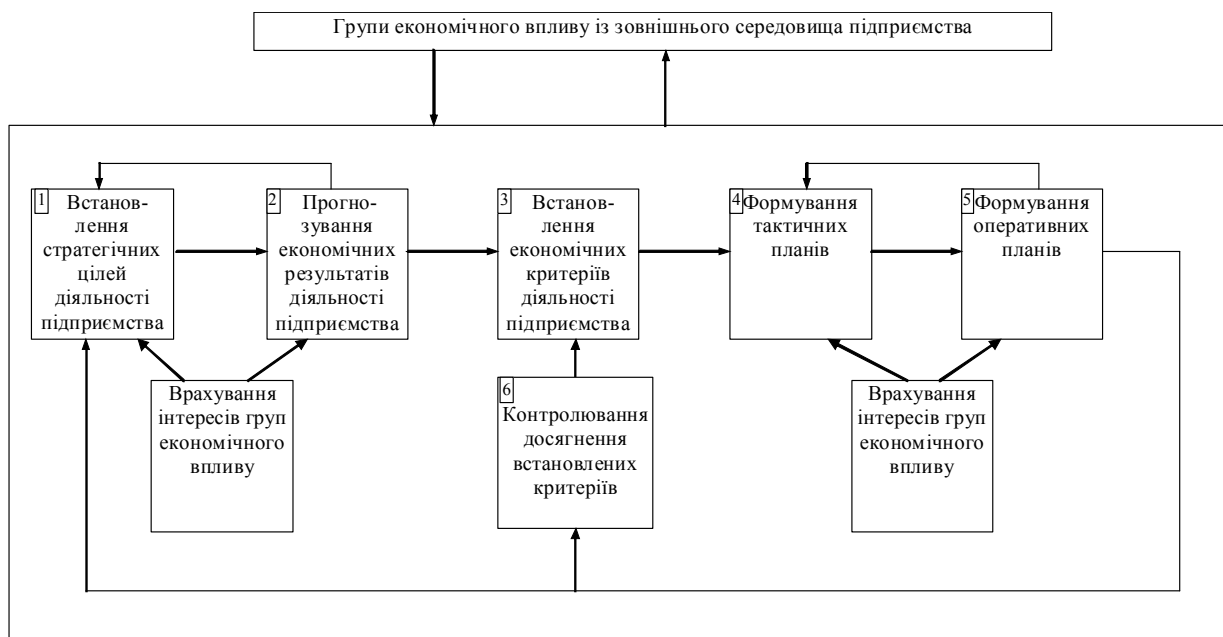
Рис. 2. Загальна схема функціонування системи планування діяльності машинобудівного підприємства при врахуванні вимог груп економічного впливу (розроблено автором на основі аналізування літературних джерел [1-9])

На основі розгляду [2, 5-7] підкреслимо, що на сьогодні існує широкий спектр якісних та кількісних критеріїв функціонування машинобудівного підприємства. Серед таких критеріїв найчастіше виділяють обсяг продажу, рівень задоволеності споживачів, вчасність поставки, прибуток, частка ринку, рівень обізнаності споживачів щодо торгової марки тощо. При встановленні таких