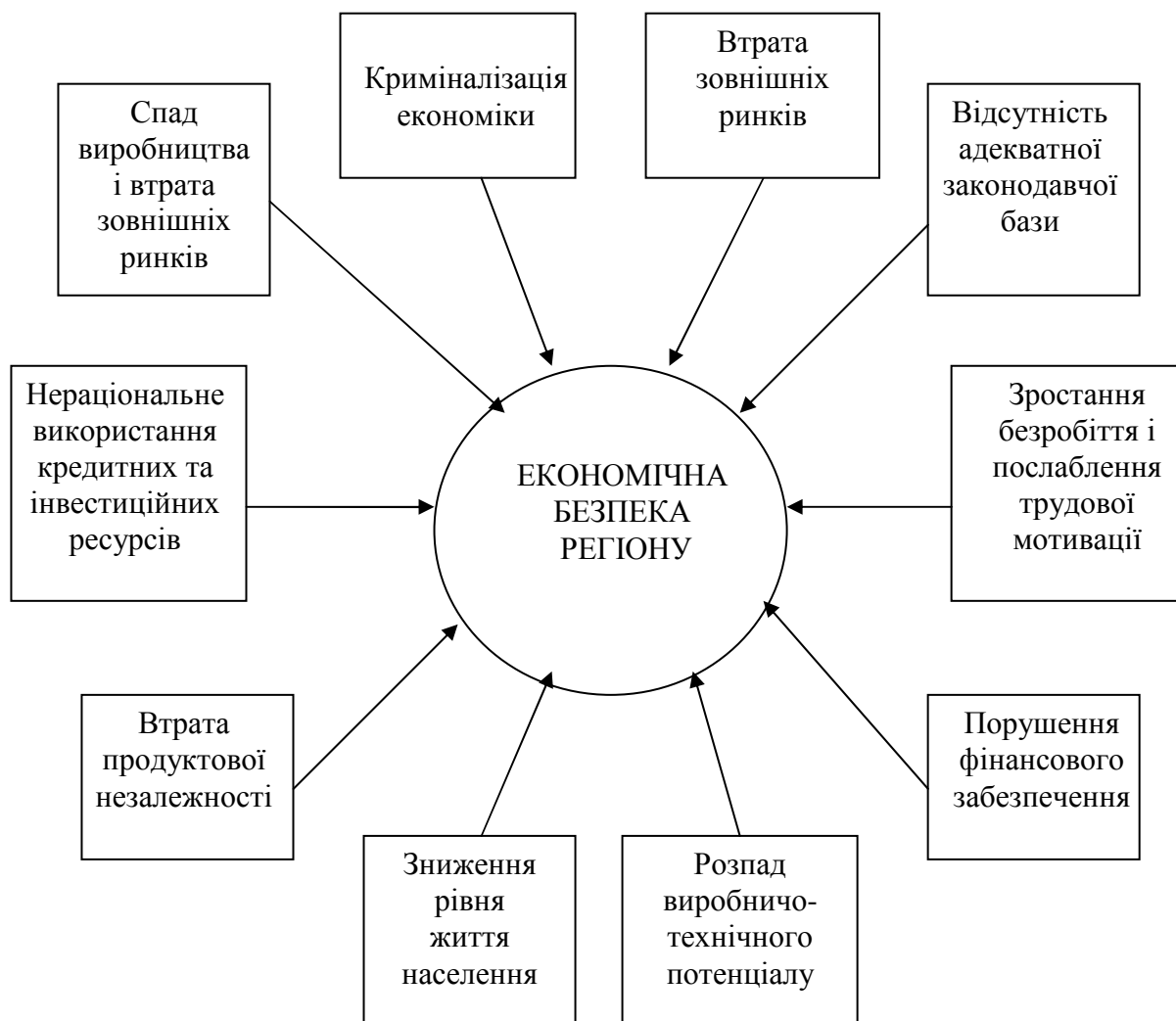
Рис. 1. Загрози економічній безпеці регіону

Економічні інтереси регіону, які виражають його потреби, є дієвим стимулятором регіонального відтворення, що нерозривно пов'язаний із процесом регіонального розвитку (див. рис. 2).