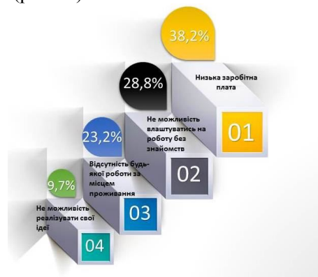
Рис. 2. Причини відтоку інтелектуального потенціалу за кордон, % [12]

Серед причин, які спонукають громадян України до пошуку роботи за кордоном найчастіше зустрічаються такі (рис. 2.).