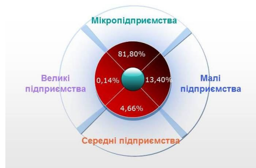
Рис. 1. Розподіл підприємств України 2014 року за їх розміром, % [9]

Сформована тенденція зниження кількості підприємств та їхньої прибутковості є загрозою для економіки України, оскільки стримує розвиток підприємництва, впливає на соціально-економічне становище кожного регіону, бо підприємства, здійснюючи свою діяльність, не тільки забезпечують новими робочими місцями населення, виробляють необхідні товари або надають певні послуги населенню, але разом з тим вони наповнюють бюджет країни (регіону), зменшують соціальну напруженість, здійснюють соціальну підтримку регіональних програм.