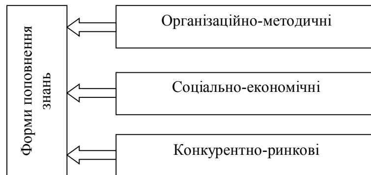
Рис. 3. Структура резервів відтворення людського потенціалу

Серед резервів поліпшення системи відтворення людського потенціалу є посилення виховної функції, активного використання різних форм поповнення знань. Останні можна об'єднати таким чином (рис. 3).