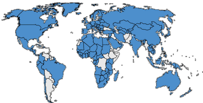
Рис. 1. Країни-учасниці РСТ [9]

Бернська конвенція про охорону літературних і художніх творів, підписана в 1886 р. є однією із найстаріших угод у захисті авторського права [8] і на даний час об'єднує понад 175 країн. Ще одна конвенція про авторське право була підписана у 1952 р. – Всесвітня конвенція про авторське право (Женевська конвенція), проте із розширенням функцій СОР своє першопочаткове глобальне значення вона поступово втратила. У 1958 р. була укладена Лісабонська угода про найменування місць походження виробів та їх міжнародної реєстрації. Патентування є одним із варіантів захисту винаходу або корисної моделі, який отримав широке розповсюдження як в розвинених країнах, так і в Україні. Розвитком патентного права став Договір про патентну кооперацію (Patent Cooperation Treaty), прийнятий у 1970 р., договірними сторонами якого є понад 150 країн (рис. 1) [9], в тому числі й Україна (з 1991 р.).