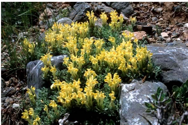
Рис. 1. Внешний вид цветущего растения Scutellaria orientalis [6]

Род Scutellaria L. в Крыму включает 10 видов, распространенных как в горной, так и в степной части [3]. Scutellaria orientalis L. шлемник восточный – полукустарничек, крымский эндемичный вид, встречается довольно обильно в горном и степном Крыму, на Тарханкутском полуострове. По ритму цветения – раннелетне-раннеосенний вид. По водному режиму – мезоксерофит, произрастает в условиях постоянного или временного недостатка влаги в почве или в воздухе, но может переносить и среднее увлажнение. По световому режиму – гелиофит, произрастает на хорошо освещенных местах, благодаря опушению, сохраняющему листья и стебли от перегрева. По отношению к засолению почвы – гликофит, приурочен к незасоленным почвам. Среда жизни – литофит, произрастает на каменистых осыпях и скалах, имея стержнекорневую глубокую систему. По особенностям вегетации относится к группе летне-зимне-зеленых. Имеет декоративное практическое значение [3, с. 71] (рис. 1). S. orientalis – критичный и недостаточно изученный вид флоры Крыма.