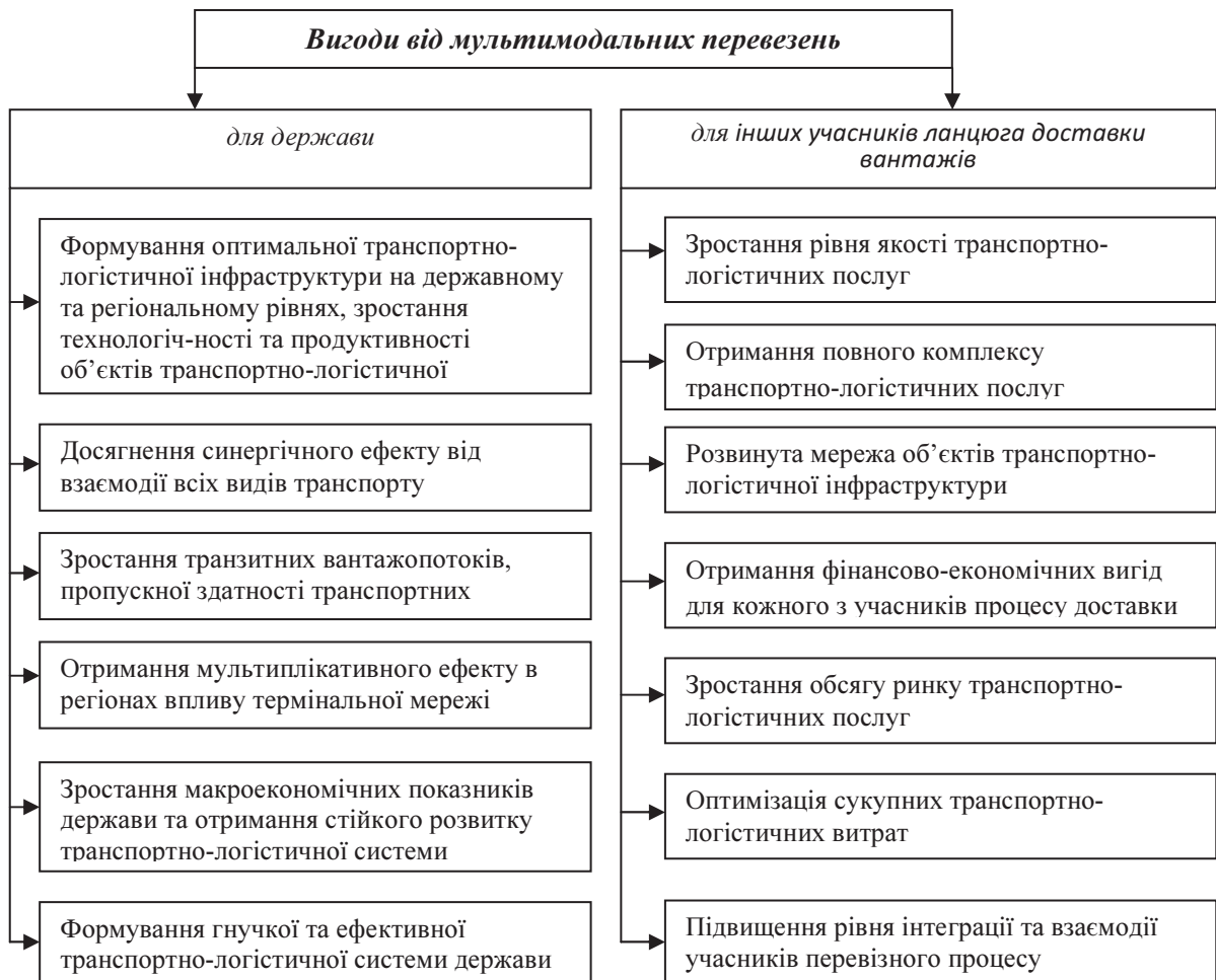
Рис. 2. Вигоди мультимодальних перевезень для держави та інших учасників ланцюга доставки вантажів

Проведене дослідження міжнародного досвіду в галузі використання транспортно-логістичного сервісу та сучасних технологій організації доставки вантажів на міжнародному рівні дозволило виявити основні напрямки забезпечення ефективного руху вантажопотоків, проаналізувати існуючі глобальні вантажопровідні мережі і, на цій основі, констатувати про доцільність та перспективність застосування мультимодальних перевезень як для держави, так й для учасників ланцюга доставки вантажів «від дверей до дверей» (рис. 2).