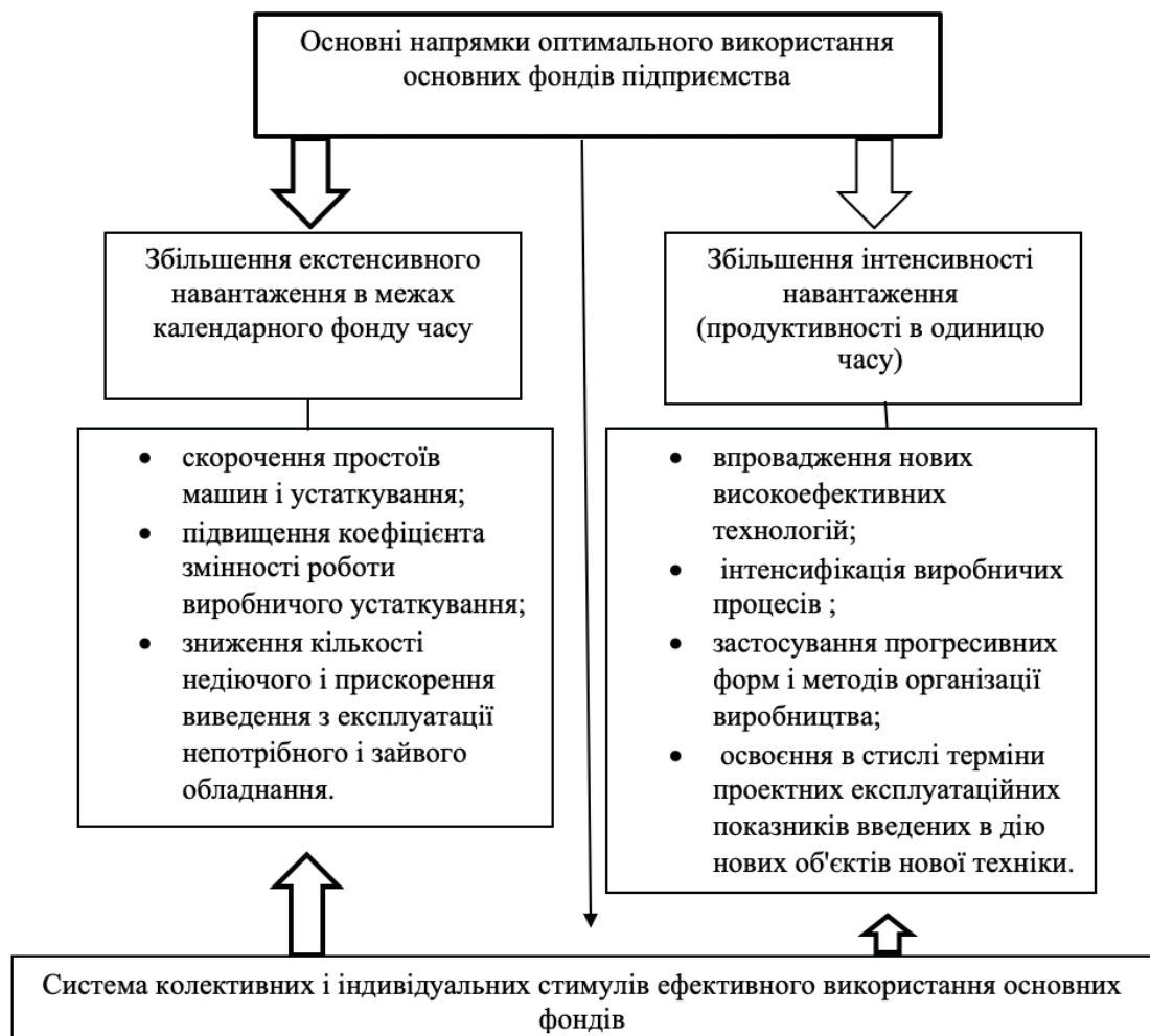
Рис. 2 Модель забезпечення ефективного використання основних фондів підприємства Джерело: [6]

Заходи, наведені на рис. 2, можна умовно розділити на дві групи 1) збільшення екстенсивного завантаження; 2) підвищення інтенсивного навантаження. При цьому потрібно звернути увагу на дві важливі обставини: по - перше, якщо екстенсивне завантаження машин і устаткування обмежується тільки календарним фондом часу, то можливості підвищення інтенсивного навантаження обладнання, його продуктивність не є обмеженими. По- друге, здійснення заходів екстенсивного напрямку, як правило, не вимагає капітальних витрат, а збільшення рівня інтенсивного використання виробничого апарату пов'язане зі значними інвестиціями.