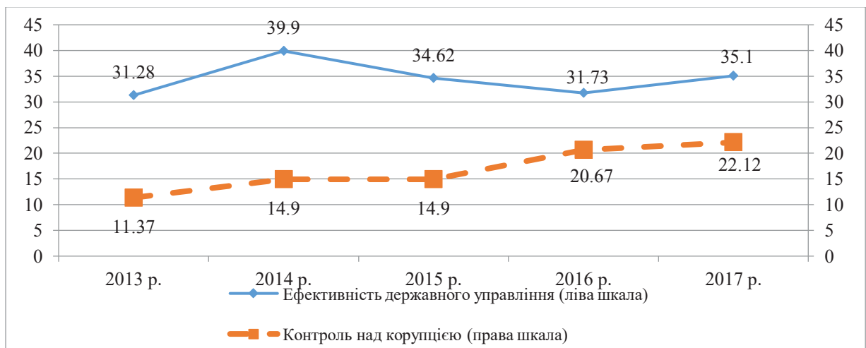
Рис. 2 Ефективність державного управління та контроль над корупцією в Україні у 2013-2017 рр., % Джерело: складено за [4]