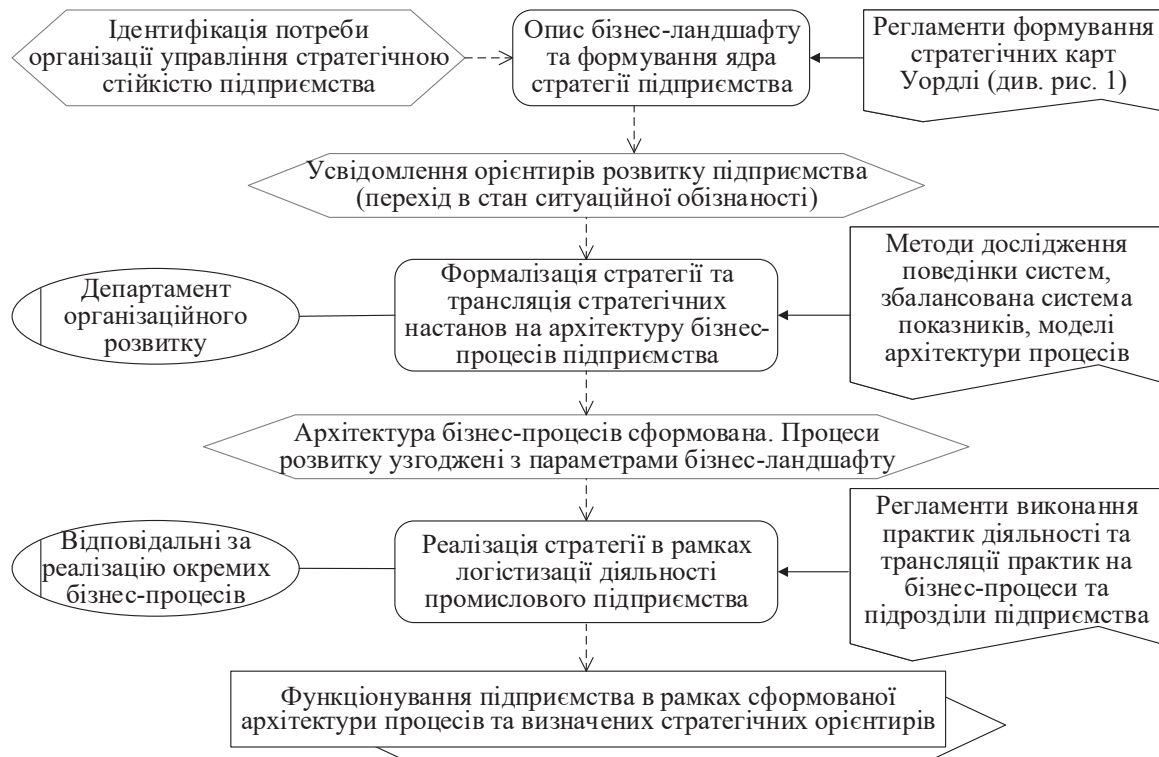
Рис. 2 Цикл управління стратегічною стійкістю підприємства на основі досягнення стану ситуаційної обізнаності