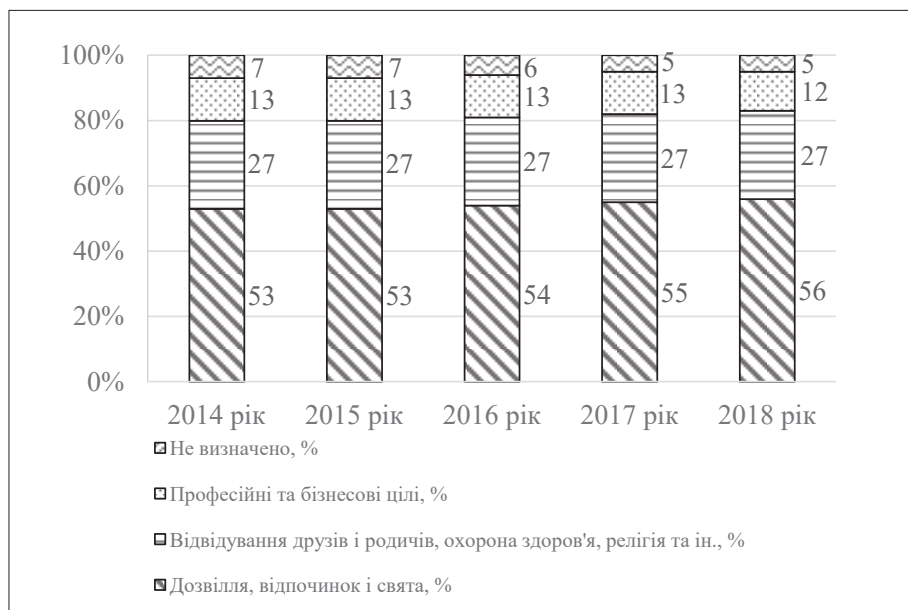
Рис. 3. Мета візиту (дані по світу)