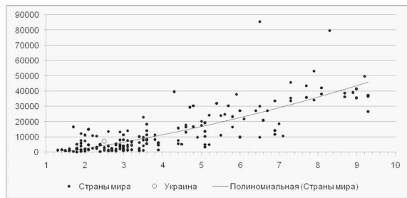
Рис. 1. Полиномиальный тренд для 175 стран мира (составлено автором на основе данных [1; 11])