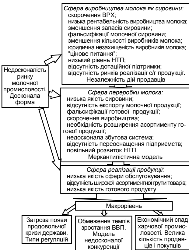
Рис. 3. Авторська інтерпретація дії дисфункціональної форми недосконалої конкуренції на ринку молочної промисловості (авторська розробка) [The authors' interpretation of the effect of the imperfect competition disfunctional form on the dairy industry market] (the authors' development)

Слід розглянути основні можливі варіанти регуляції даного ринку.