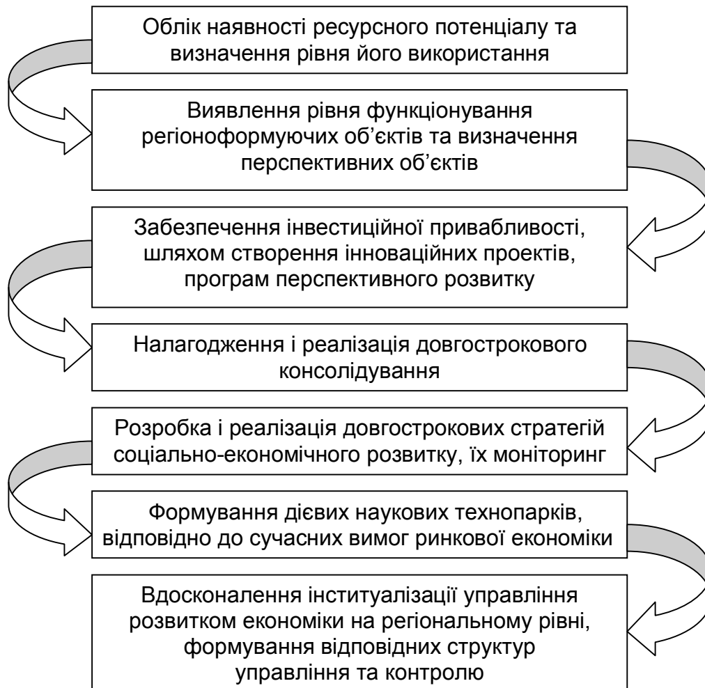
Рис. 2. Механізми модернізації розвитку ринкової економіки

господарських рішень та призвести до незадовільних наслідків. Так, кожний із запропонованих механізмів модернізації потребує певних підходів, адаптованих до умов конкретних регіональних утворень з урахуванням їх якісних відмінностей. При чому, необхідною умовою забезпечення організаційно-управлінських передумов впровадження інструментарію модернізації має стати зміна підходів у керуванні соціально-економічним розвитком. А на сьогодні, в умовах обмеженості внутрішніх ресурсів, забезпечити економічний розвиток доцільно при залученні зовнішніх інвестиційних ресурсів.