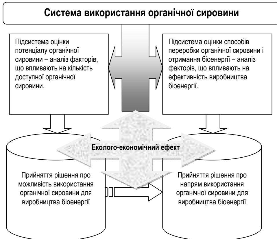
Рис. 2. Система регулювання використання біомаси сільськогосподарських культур у виробництві біоенергії*

Якщо потенціал побічної продукції не задовольняє потреби господарства, то приймається рішення про відхилення від реалізації проекту щодо виробництва біоенергії. Розглядається рішення про можливість покращення сировинного, технічного потенціалу для здійснення процесу виробництва біоенергії в майбутньому.