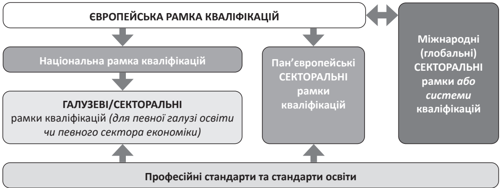
Рис. 2. Ієрархія різних видів рамок і систем кваліфікацій