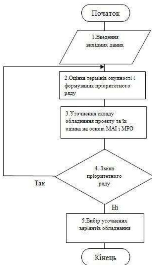
Рис.3. Алгоритм вибору складу обладнання та технологій проектів енергоспоживання на основі СППР