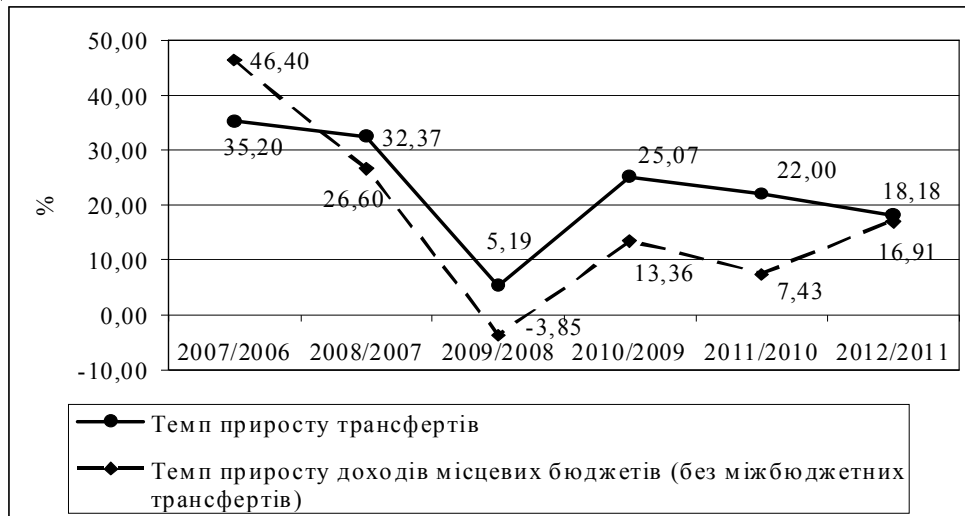
Рис. 2. Темпи приросту міжбюджетних трансфертів і доходів місцевих бюджетів (без урахування міжбюджетних трансфертів), %

Примітка: розраховано за даними Інституту бюджету та соціально-економічних досліджень.