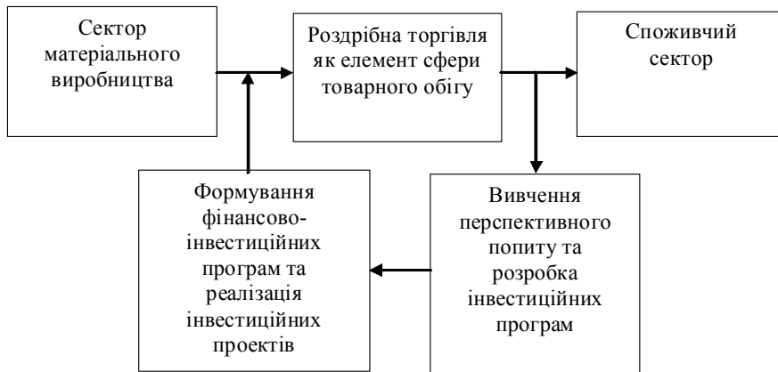
Рис. 2. Координуюча роль роздрібно́ї торгівлі з розвитку та “зближення” сфер виробництва і споживання в Україні (розроблено автором)

значно вищі шанси подальшої життєдіяльності і розвитку. Від цього залежить їх економічна безпека.