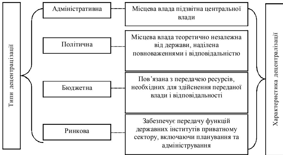
Рис. 3. Типи та характеристика децентралізації

Так, формування місцевих державних адміністрацій розглядають як складову децентралізації, тоді як місцеве самоврядування визначають як прояв деконцентрації. Процес децентралізації державних функцій складається з таких компонентів, як деконцентрації та деволюції. Деволюція – це надання прав органам самоврядування приймати рішення і здійснювати самостійну фінансову та управлінську діяльність, якщо не передбачено реалізації єдиної державної політики. Тобто органи місцевого самоврядування за законодавством набувають незалежного статусу. Деконцентрація – це адміністративна децентралізація, що передбачає створення на місцях спеціальних урядових органів та наділення їх повноваженнями із здійснення виконавчої влади. Її інколи виділяють як форму децентралізації або вид централізації, адже територіальні органи державної влади залишаються підпорядкованими центральним.