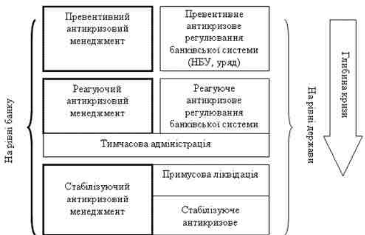
Рис. 2. Послідовність антикризових менеджменту та регулювання діяльністю банку

На рис. 2 відображено послідовність реалізації заходів антикризового впливу на діяльність банків.