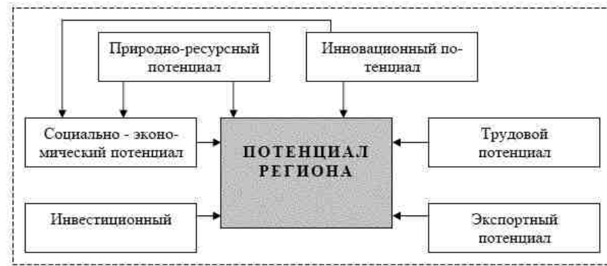
Рис. 1. Составляющие регионального потенциала

Предложенный автором подход к оценке потенциала региона, ставит перед собой целью локализацию, снижение остроты и последующее устранение кризисных явлений в экономике и социальной сфере на наиболее подверженных этим явлениям территориях не только Крыма, но и всей Украины.