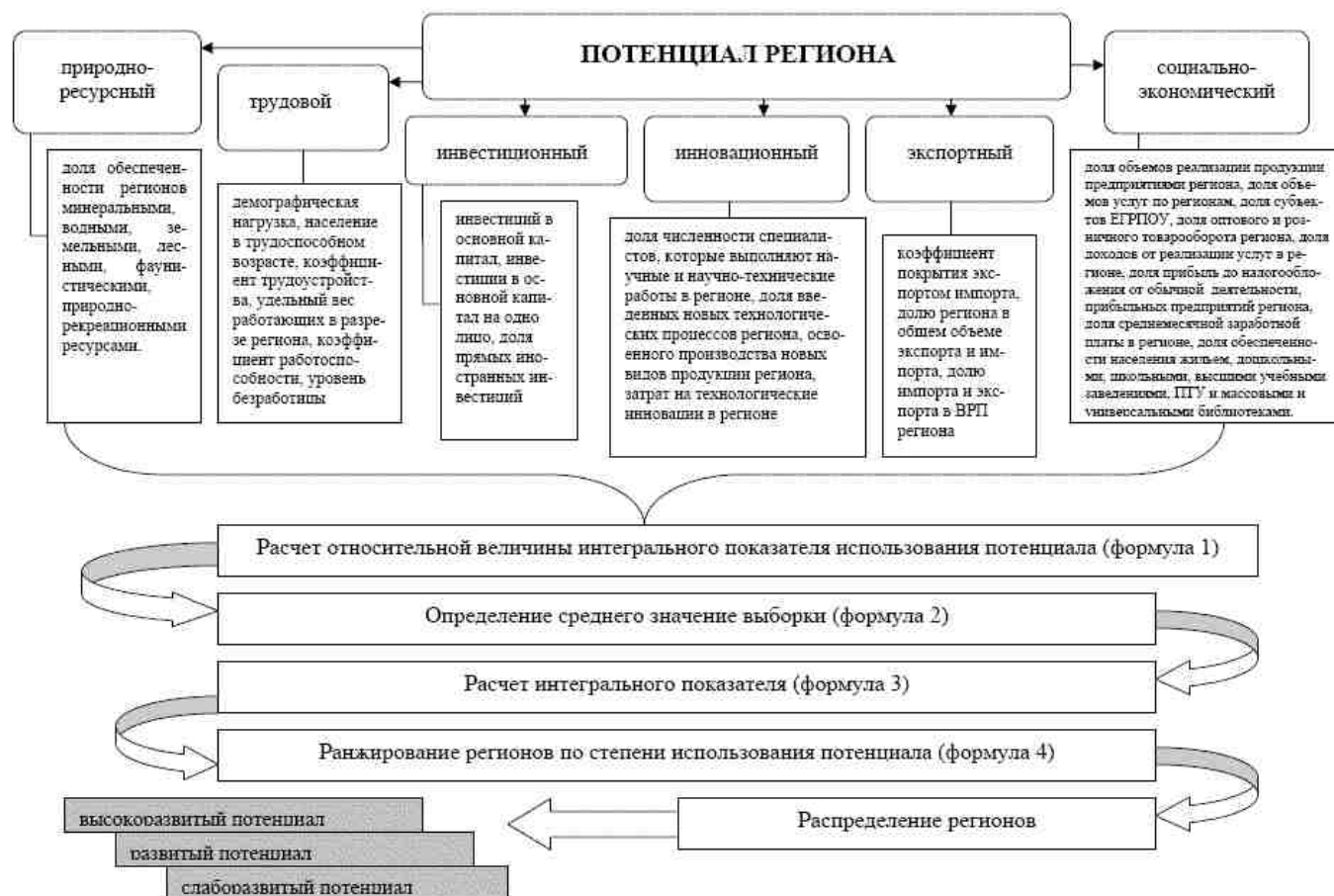
Рис. 2. Рекомендуемая последовательность оценки регионального потенциала

При оценке социально-экономического потенциала региона необходимо изучить такие его составляющие как: долю объемов реализации продукции предприятиями региона, долю объемов услуг по регионам, долю субъектов ЕГРПОУ, долю оптового и розничного товарооборота региона, долю доходов от реализации услуг в регионе, долю прибыли до налогообложения от обычной деятельности, прибыльных предприятий региона, долю среднемесячной заработной платы в регионе, долю обеспеченности населения жильем, дошкольными, школьными, высшими учебными заведениями, ПТУ и массовыми и универсальными библиотеками.